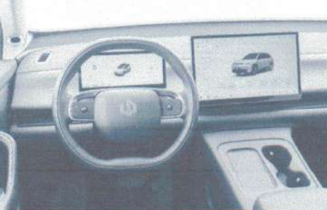
Leapmotor C10 tem central multimídia com 14,6 polegadas

A segunda versão usa um conjunto REEV (híbrido em série) formado por um motor 1,5 de gasolina de até 96 cv que funciona unicamente para abastecer a bateria de 28,4 kWh. Esta, por sua vez, alimenta um motor elétrico de 215 cv. Dessa forma, a tração é 100% elétrica, sem que as rodas se movam com interferência direta da unidade a combustível.