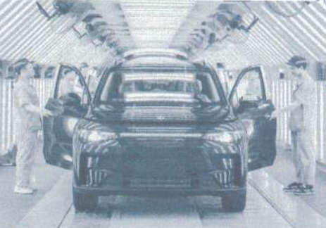
Leapmotor C10 será produzido em Goiana (PE)

Como o Leapmotor B10 O B10 foi apresentado no Salão de Paris de 2025 e tem porte considerado médio. Ao todo, possui 4,51 metros de comprimento, 1,88 m de largura e 1,65 m de altura, além de 2,74 m de entre-eixos. O porta-malas acomoda 430 litros. Como comparação, o BYD Yuan Plus mede 4,45 m de comprimento, 1,87 m de largura, 1,61 m de altura e 2,72 m de entre-eixos. Disponível atualmente em versão única, o B10 tem motor elétrico traseiro